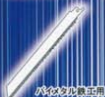
バイメタル鉄工用