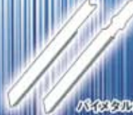
バイメタル鉄工用