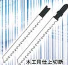
木工用仕上げ切断